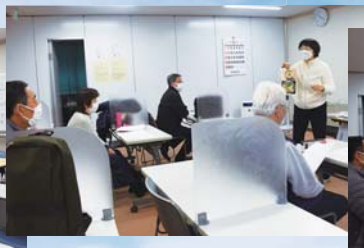
生活関連の言葉や文化の紹介及び実用方法