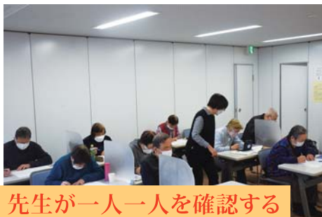
先生が一人一人を確認する

内容：日常的な場面を取り上げ、そこで必要な会話や日本事情について学習します。また、トピックスを選びそれについて話す練習をします。