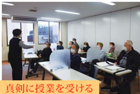
真剣に授業を受ける